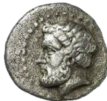
Монета на Котис I с негов образ, 383 – 359 г. пр. Хр.